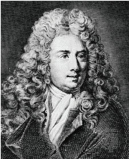
Portrait gravé d'Antoine Galland

Académie des Inscriptions et Belles-Lettres, Grande salle des séances