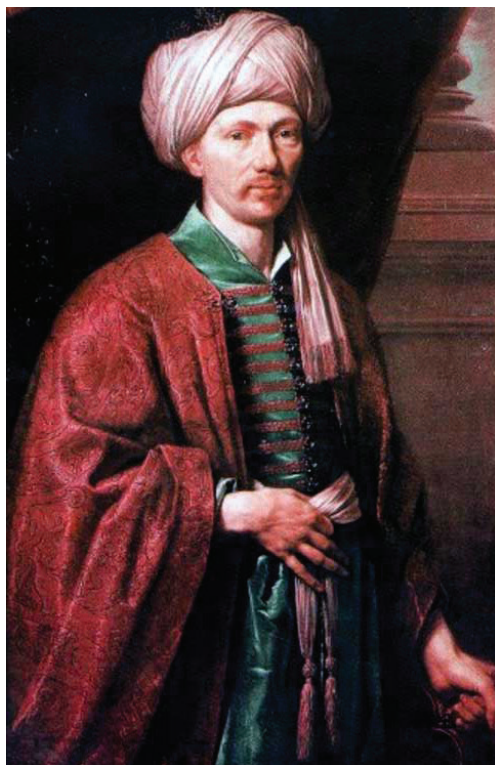
Portrait présumé d'Antoine Galland

à l'Académie des Inscriptions et Belles-Lettres, Grande salle des séances du Palais de l'Institut de France