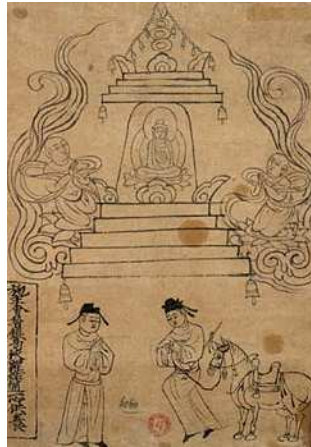
Le commissaire Luo vient rendre hommage au Bouddha figuré dans un stupa, Dunhuang, X e siècle, peinture au trait sur papier. BNF, Département des Manuscrits