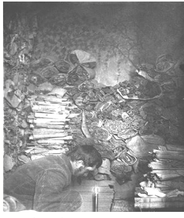
Paul Pelliot examinant des rouleaux dans la grotte aux manuscrits et aux peintures à Dunhuang. Paris, musée Guimet.

Au début de l'année 1908, Paul Pelliot arrive à Dunhuang, où il examine les dizaines de milliers de manuscrits récemment découverts dans une grotte scellée depuis neuf siècles, manuscrits qui vont transformer totalement l'histoire de la Chine médiévale et apporter des données entièrement nouvelles sur les échanges entre l'Inde, l'Asie centrale et la Chine. En dépit de certaines polémiques, l'importance des documents qui étaient rapportés à Paris se révéla telle qu'elle apporta immédiatement à Paul Pelliot la célébrité et l'accès aux plus hautes fonctions académiques. Mais la curiosité intellectuelle du savant, l'étendue de son savoir, l'assurance et la justesse de son jugement, ses formidables capacités de travail, en ont fait un homme de légende. Ouvert aux études tibétaines, turques, mongoles ou iraniennes, ainsi qu'à celles de l'Annam et du Cambodge dans ses premiers travaux, Paul Pelliot couvrit tous les domaines de la sinologie, de l'histoire aux religions, de la philologie aux arts, entretenant des contacts étroits avec ses collègues du monde entier. Il fut sans aucun doute le premier sinologue occidental à traiter d'égal avec