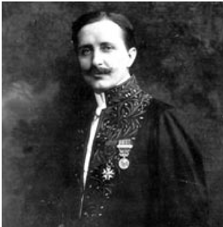
Paul PELLIOT, élu le 6 mai 1921 membre de l'Académie des Inscriptions et Belles-Lettres au fauteuil de Robert LASTEYRIE DU SAILLANT, en habit d'académicien.